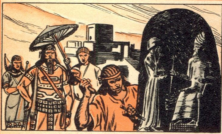
1. — DE GEDENKZUIL VAN HAMMOERABI

H AAL vlug je atlas en zoek een kaart van Klein Azië. Wanneer je goed kijkt, ontdek je daarop drie kleine landen: Irak, Syrië en de Libanon. Veel mensen weten niet eens dat deze landen bestaan, want in de huidige geschiedenis spelen ze geen rol meer. Syrië en de Libanon hebben sedert enkele tijd hun onafhankelijkheid verkregen. Wanneer men over Irak spreekt is dit gewoonlijk slechts in functie van de petroleumbronnen, die af en toe herrie veroorzaken. Hier bloeide eens een van de machtigste keizerrijken ter wereld.