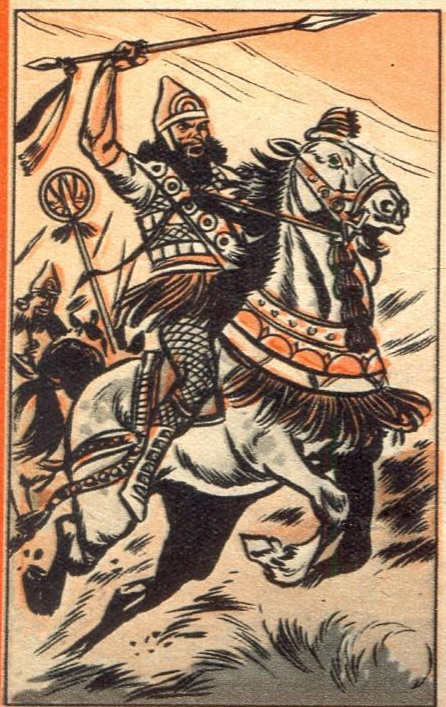
2. — EEN RUW VOLK

OP het tijdstip dat de civilisatie van Egypte begint, bloeide er op de oevers van Tigris en Eufraat, namelijk in Mesopotamië — d.w.z. land tussen twee stromen — een beschaving van een heel andere aard. Het Zuiden van dit land, Chaldea, was de eerste beschavingshaard, nu meer dan 4.000 jaar geleden. Te Babylon troonde er een koning, die Hammoerabi heette en op een 2,25 m. hoge gedenkzuil in zwart dioriet de zogenaamde Wet van Hammoerabi liet beitelen. Deze gedenkzuil zie je thans in het Louvre te Parijs.