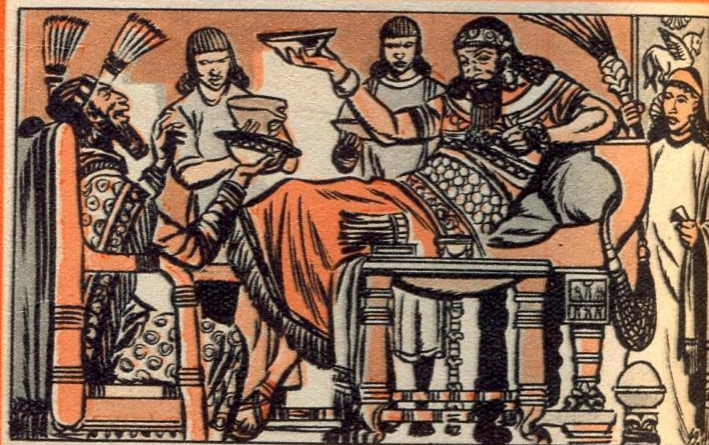
5. — HET BACCHANAAL VAN BELSAZAR

EEN van de grootste koningen van Babylon was Nabukadnezar. De prachtige stad zelf was uitgebouwd tot een vesting. Ze was omringd door een 45 km. lange muur in baksteen met 150 torens en 100 poorten. De straten van de stad sneden elkaar in een rechte hoek, en er waren ook de hangende tuinen, een van de zeven wereldwonderen. Men telde er 8 reusachtige zigoerats, tempels met 7 verdiepingen van een verschillende kleur.